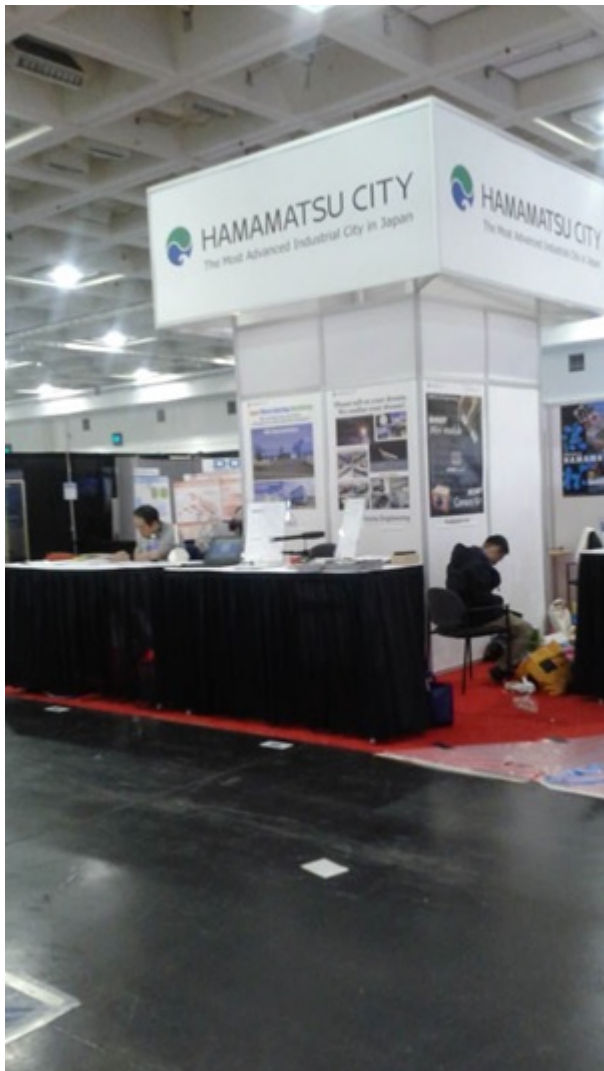
通りに面して目立つ浜松市ブース全体