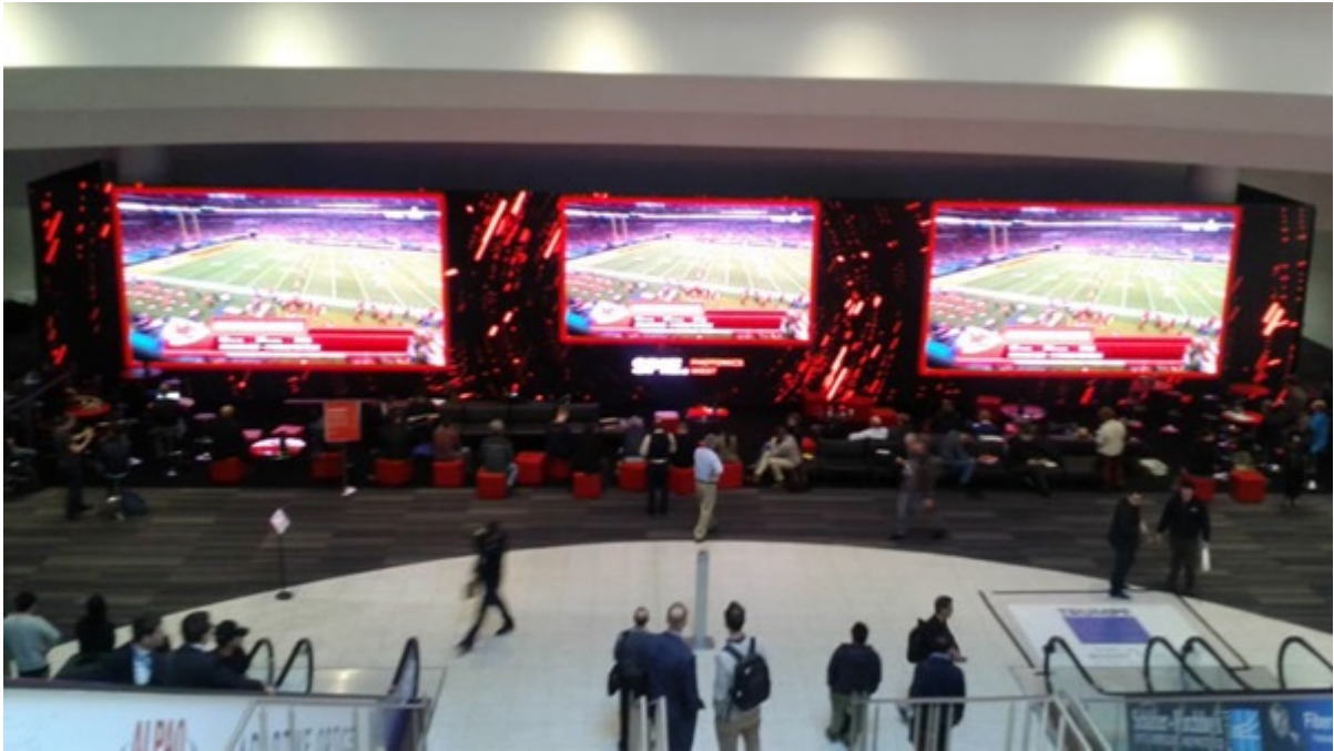
地下1階の展示会ブース入口の巨大スクリーン